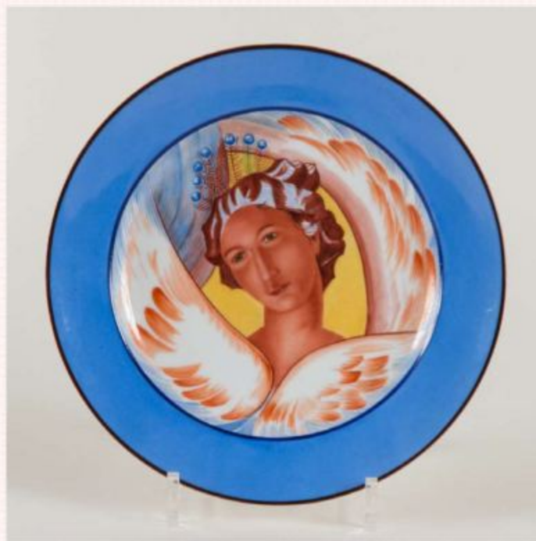
Тарелка "Жар-птица" по эскизу К.Петрова-Водкина, 1923 год

А дальше Петров-Водкин уже так врос в советскую жизнь, что ему надо было раздвоиться, чтобы и заниматься творчеством, и быть человеком официальным. Он не смог. Петров-Водкин был председателем союза художников, депутатом Ленсовета, работал на Ленинградском фарфоровом заводе им. М.В. Ломоносова, преподавал в Академии художеств и писал теоретические работы.