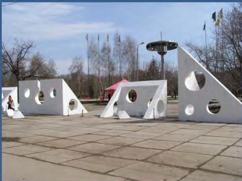
Парк им. Ю. Гагарина в Самаре