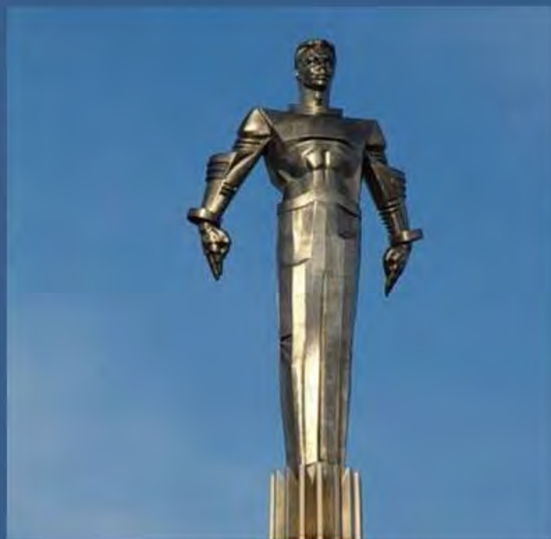
Памятник Ю. Гагарину в Москве

Во многих городах России и других стран существуют улицы, проспекты, площади, бульвары, парки, клубы и школы имени Гагарина.